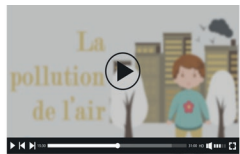
Vidéos de sensibilisation