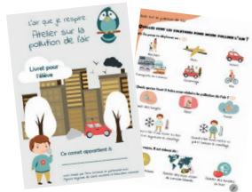
Livrets élèves avec enquête, quizz, expériences etc.