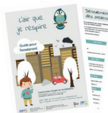
Guide pour l'enseignant (déroulé, etc.)