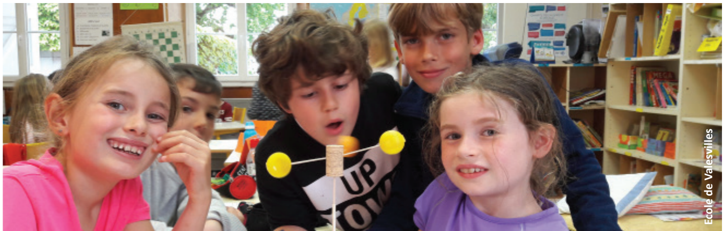
Ecole de Valesvilles

La volonté est de susciter la réflexion, faire prendre conscience que de nombreux éléments impactent la qualité de l'air mais aussi, et surtout, que chacun à son rôle à jouer. Loin d'un discours alarmiste, les enfants découvrent par la discussion, la déduction, le jeu, l'importance de prendre soin de l'air qui nous entoure.