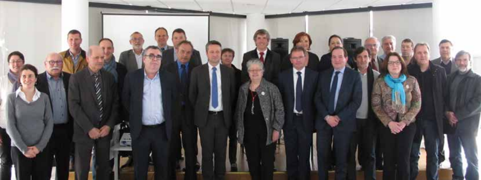
Les membres du conseil d'administration d'Atmo Occitanie élus le 1 er mars 2017 : élus parmi les membres adhérents de l'observatoire, ils sont représentants de quatre collèges : État, Collectivités, Industriels, Associations et personnalités qualifiées.