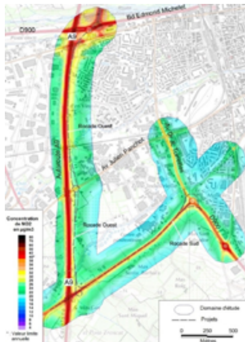
Concentrations moyennes annuelles de NO 2 - État initial 2013